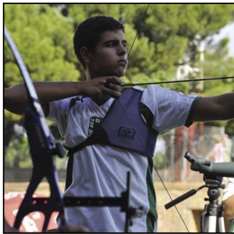
L'olesà guanya tres medalles