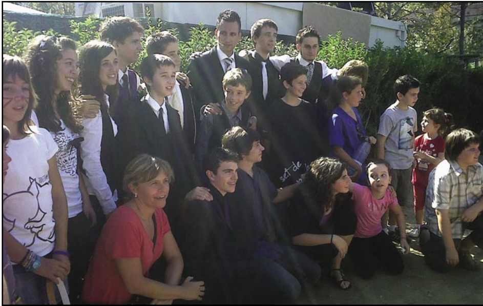
El mag olesà en La Mercè