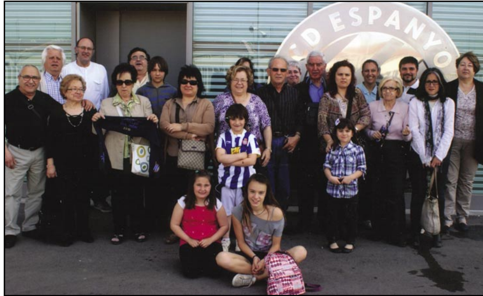
Penya olesana de l'Espanyol

En la jornada de dissabte van arribar les primeres medalles per Catalunya a l'aconseguir 2 bronze per autonomies, en Cadet i Infantil, darrera de Madrid. En Infantil individual femení, va debutar