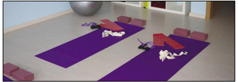
Nou espai per cuidar-se