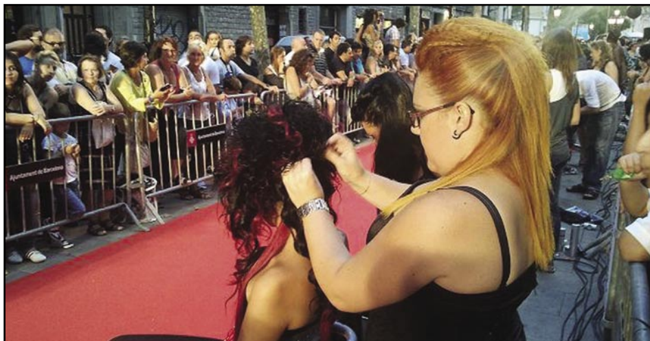
Moda olesana for export