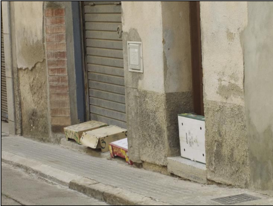
Defensa contra els gats

El periòdic 08640 no es fa responsable del contingut de les cartes (opinions, comentaris, rèpliques i suggeriments d'interès general, respectuosos cap a les persones i institucions), i es reserva el dret de publicar-les i resumir-les si és necessari. Els articles que no es publiquen en aquesta edició per falta d'espai, sortiran a les properes edicions. Les cartes per a aquesta secció han de signar-se amb el nom i cognom de l'autor, DNI, telèfon i adreça. S'han d'adreçar al tel/fax: 93 772 94 36 o a l'a/e: periodic08640@hotmail.com