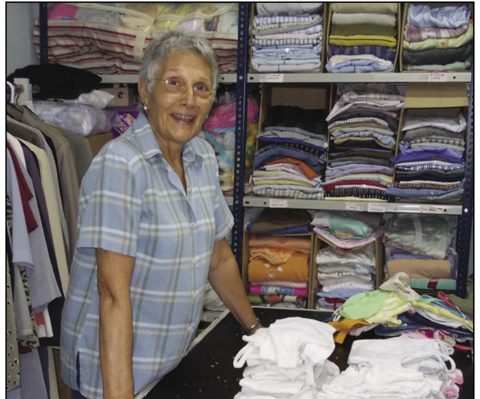
Es necessiten mantes

La propera reunió d'alcaldes del Baix Llobregat Nord amb les autoritats sanitàries de la Generalitat, es farà el 4 d'octubre.