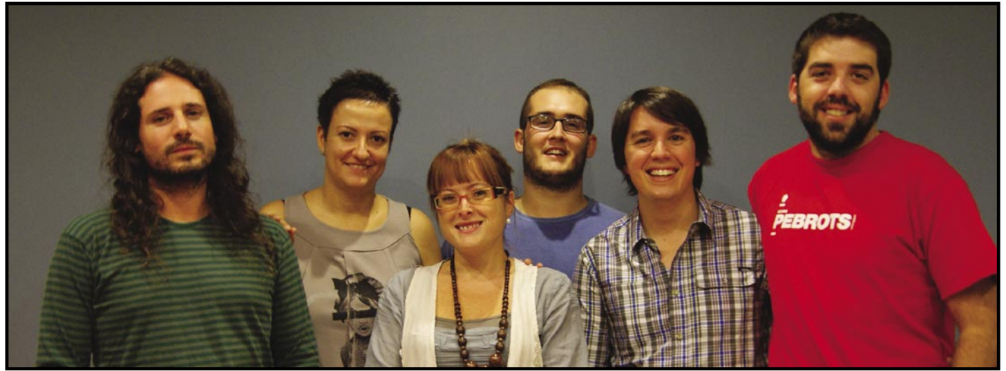
Part de l'equip d'Olesa Ràdio

L'emissora municipal Olesa Ràdio arrenca el proper dilluns 3 d'octubre la nova programació de tardor-hivern, amb una total renovació de la seva graella. Informació, entreteniment, tertúlies, música i esports són alguns dels ingredients de la nova programació, que té una clara voluntat de servei públic, i que com és habitual, també es nodreix gràcies a l'aportació de