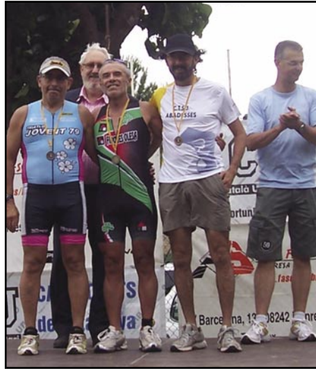
Pareja a Manresa