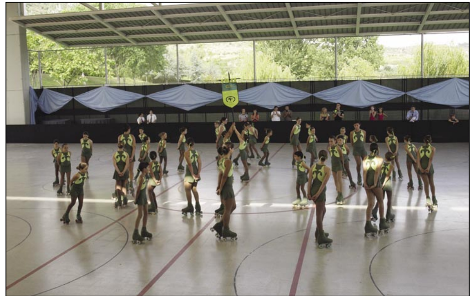
Festival del Club Olesa Patí

El equipo benjamín del Fútbol Sala Olesa se ha consagrado campeón de Primera División. Con 20 partidos jugados, han ganado todos los puntos en juegos (60) y con la extraordinaria cifra de 266 goles