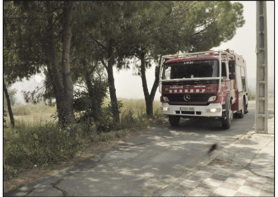
Foc a Les Planes