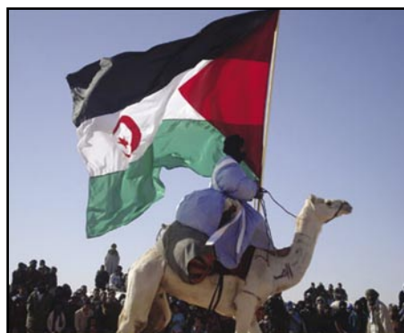
LA BANDERA DE LA HADI

Els passats 24, 25 i 27 de juny van arribar a Olesa 8 nens sahrauís per passar els mesos de juliol i agost amb una família d'acollida designada per ACAPS. A més de gaudir d'activitats de lleure, els nens es faran una revisió mèdica general al CAP. L'objectiu d'aquesta estada és que els infants sahrauís convisquin amb infants catalans i coneguin les nostres costums. A més a més, per tal de que els infants sahrauís, sobretot en els primers dies, no trobin a faltar els seus companys s'organitzaran activitats de lleure conjuntes entre totes les famílies de cada municipi o zona. A finals del mes d'agost o principis del mes de setembre els infants retornaran als campaments de refugiats sahrauís de Tindouf.