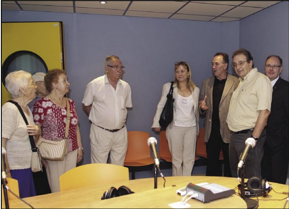
Nou estudi d'Olesa Ràdio