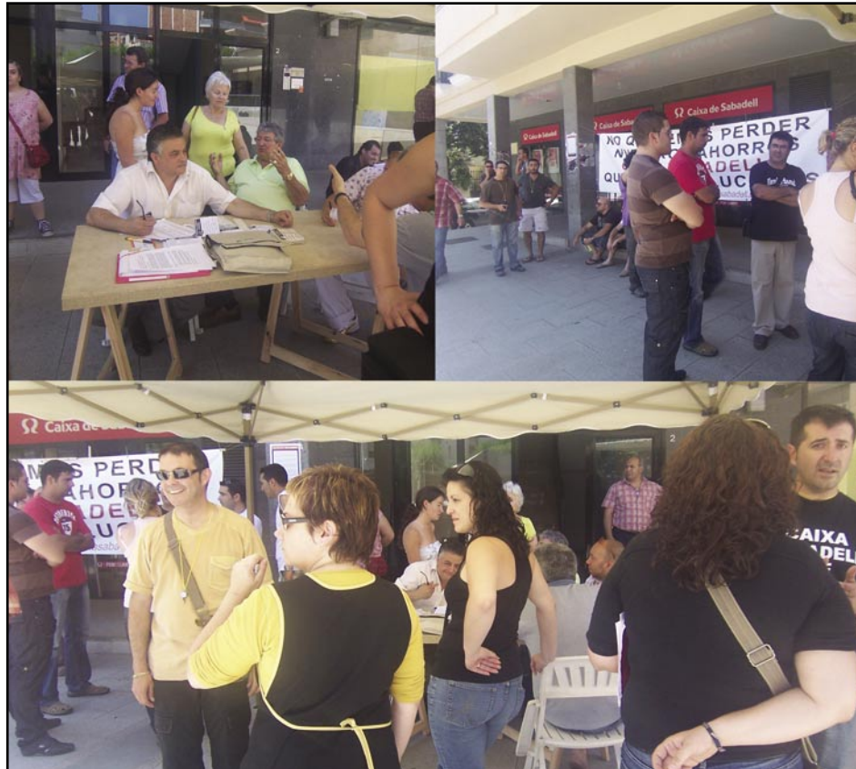
Manifestació d'inversors afectats