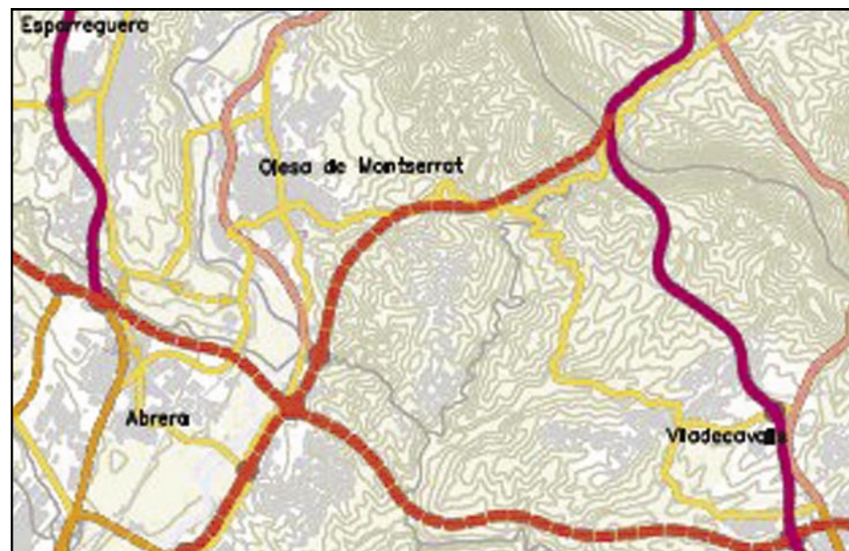
Proposta actual PTM. En vermell, traçat de la nova autovia; en rosa, la C-55 Mapa: Bloc Olesà