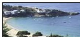
Cala Montjoi. (Roses). 2n ESO