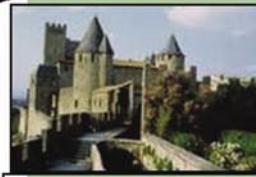
Sud de França. 3er ESO.