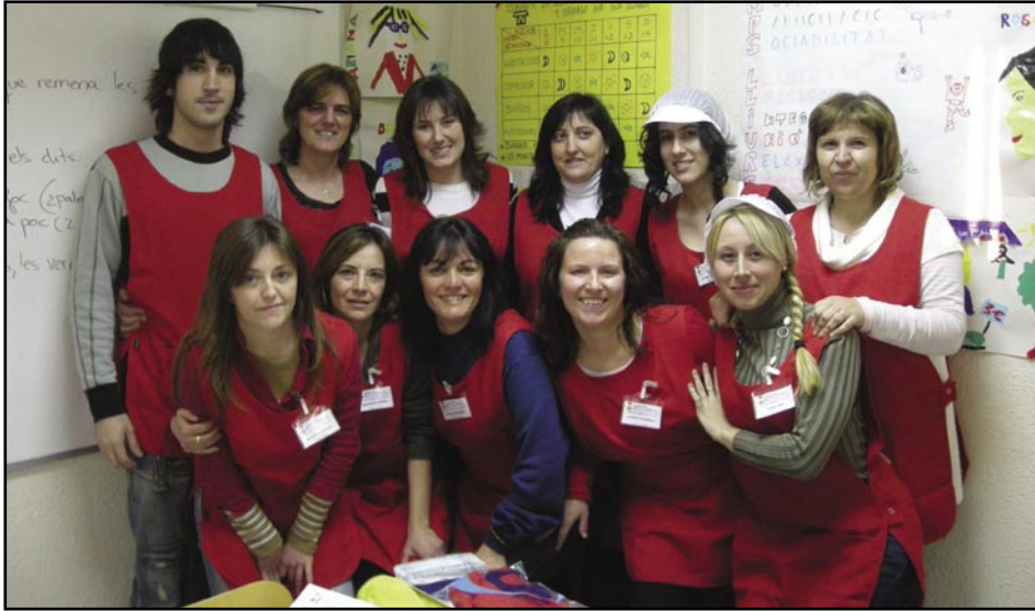
Alumnes del curs de Monitor/a Sociocultural