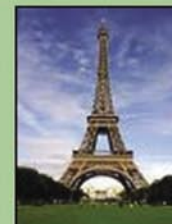
París. 4rt ESO.