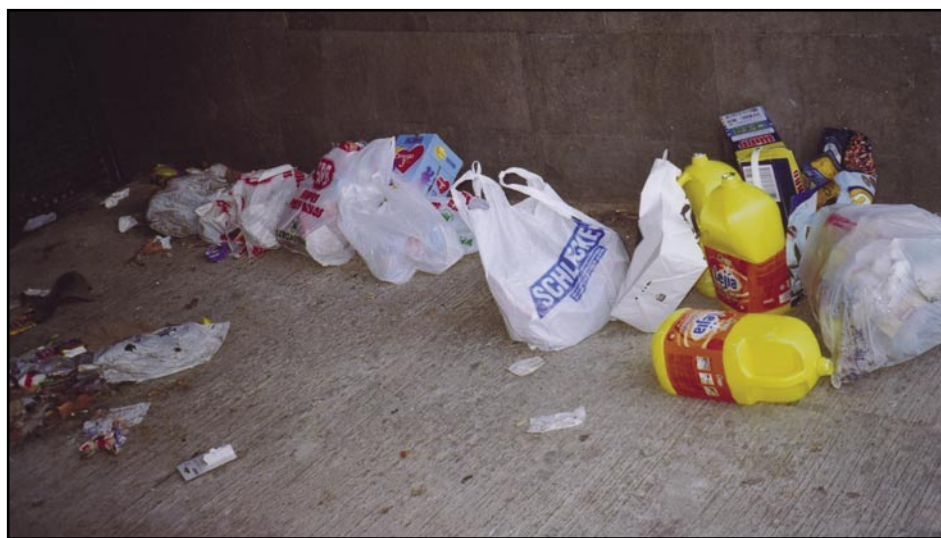
Entrada al pàrking o contenidor?