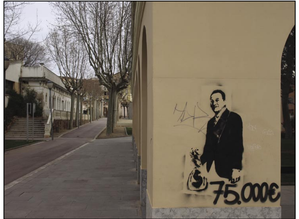
Pintades a l'Ajuntament

1) Per què no va donar cap solució coherent al problema de la forma que li corresponia al càrrec?