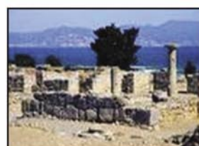
Empúries. 2n Batx.