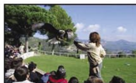
Cim d'Àligues. 1er ESO.