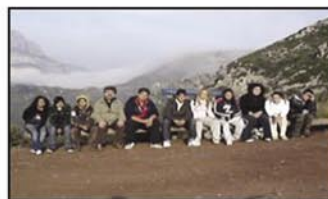
Pla del Fideuer. 3er ESO.