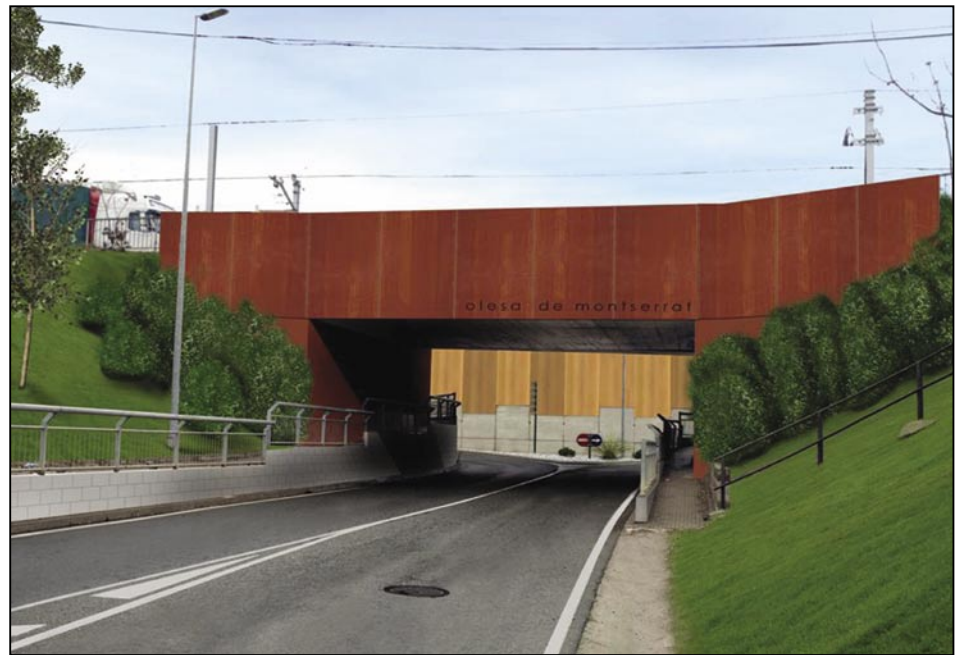
Futura entrada sud d'Olesa