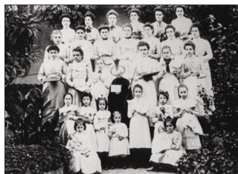
Alumnes del 1899