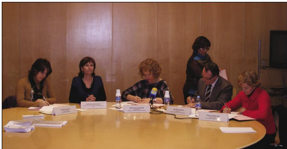
Signatura Taller d'Ocupació

A Olesa s'executaran 21 projectes, per casi 4 milions d'euros i que utilitzaran 252 llocs de treball. Aquests són els projectes aprovats a Olesa amb el Fons Estatal d'Inversió Local, i un detall de l'import de cada un d'ells i el nombre de llocs de treball que se'n derivarà, entre parèntesis: Urbanització i millora de l'espai públic urbà de la carretera de la Puda entre els carrers Menéndez Pelayo i Ripollés: 277.603,18 € (15); construcció d'una pista de patinatge (Skate park): 74.147,10 € (6); rehabilitació de les cambres frigorífiques del Mercat Municipal: 102.637,00 € (4); rehabilitació de les dependències de la planta baixa de la Casa Consistorial: 59.530,38 € (15); rehabilitació del Parc de Les Planes: 386.323,89 € (12); urbanització de la zona de davant del cementiri vell per a la ubicació d'un aparcament públic destinat a promoure la mobilitat sostenible a l'Eixample de la vila: 64.567,75 € (10); urbanització d'un solar davant el Molí de l'Oli per a la creació d'un aparcament dissuasori destinat a promoure la mobilitat sostenible al centre d'Olesa: 39.582,54 € (10); rehabilitació de quatre habitatges municipals per a ús social: 140.541,37 € (20); arranament de l'accés de la C-55 a Olesa de Montserrat: 180.000 € (13); reforma de la instal·lació d'enllumenat exterior dels carrers Calvari, Anselm Clavé, Francesc Macià, Colón, Metge