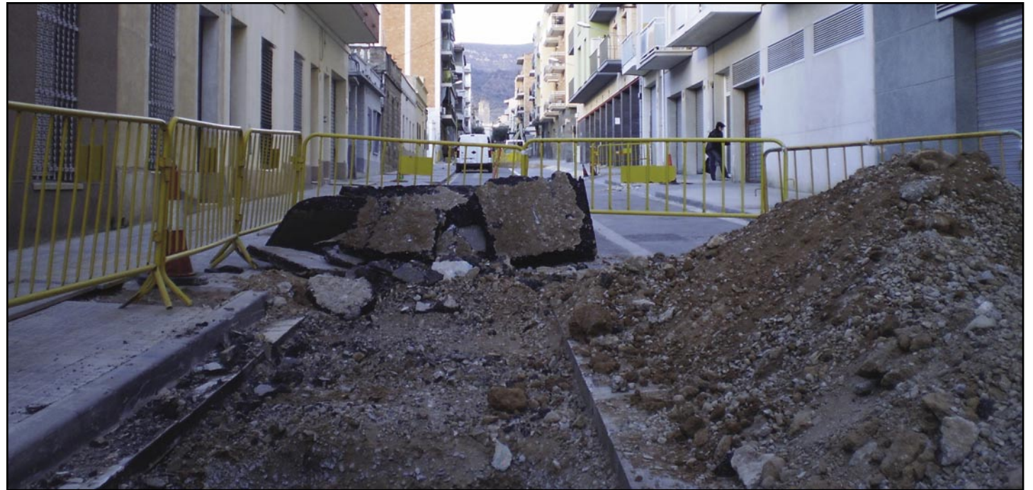
Van començar les obres al carrer Alfons Sala