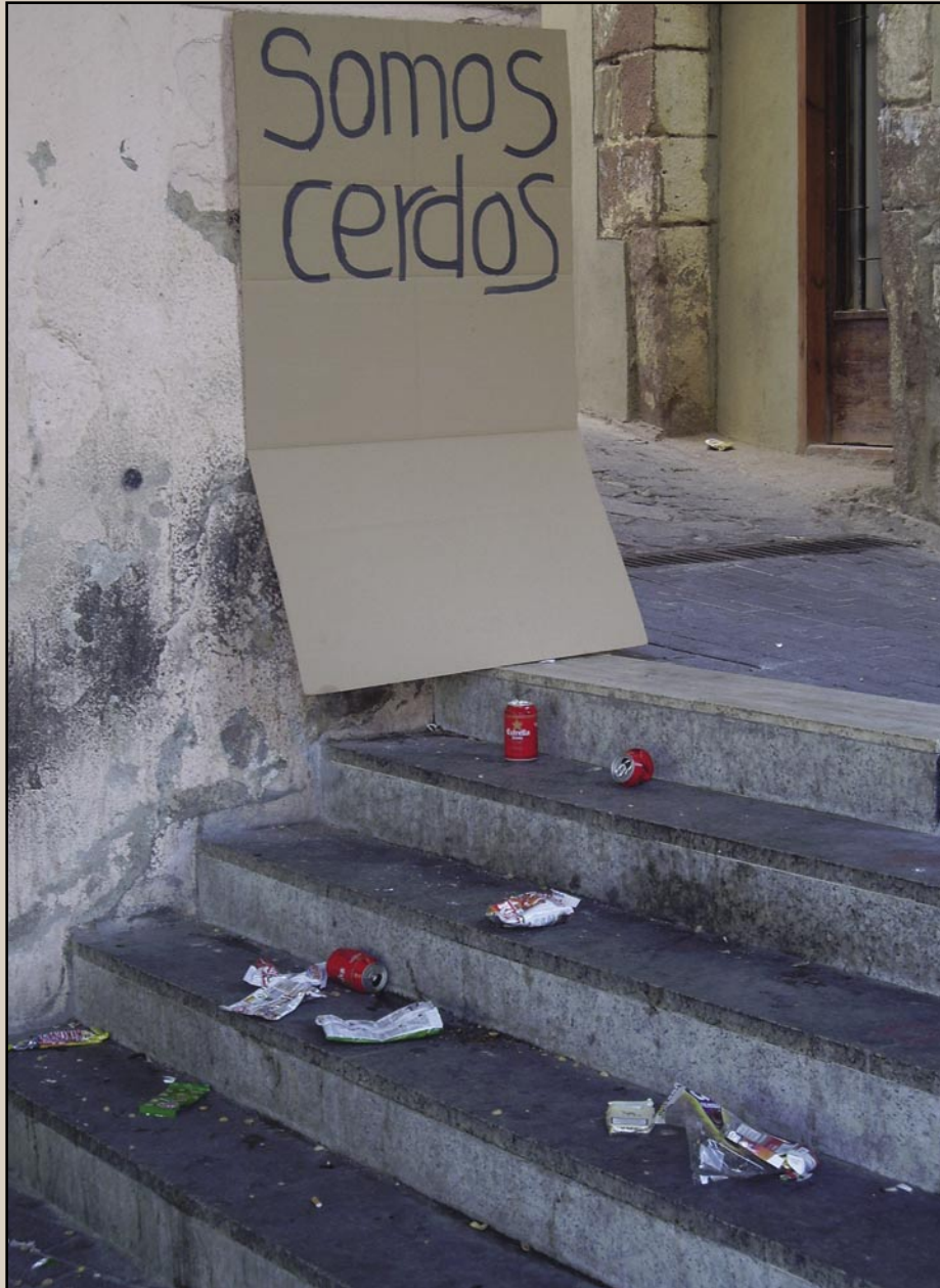
Escales a la Plaça de les Fonts