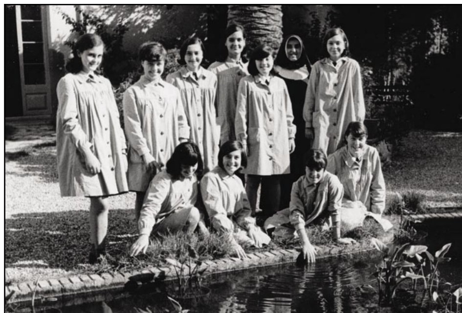
Alumnes i religiosa al jardí de l'escola (anys 60)

En l'actualitat acull més de 400 nens i joves des de 0 als 16 anys i es viu contínuament el record de la Santa a diferents indrets de la casa: la capella (que conté les seves despulles), el menjador original de la comunitat en la seva època, la cel·la on va viure i