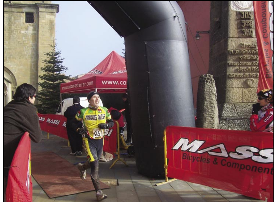
Pareja, campió un altre cop