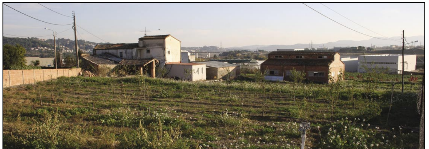
Vista panoràmica d'una zona de Vilapou

Lo de escuchar a las dos partes, te digo que así fue. Todos los miembros de esta Junta, que asistimos a las dos reuniones de los partidos escuchamos atentamente lo que exponían. Algunas cosas nos parecieron bien y otras no, como a todos los asistentes. Lo de "fulano" nos parece muy fuerte y una falta de respeto impropia de una persona que se autodenomina "vecina