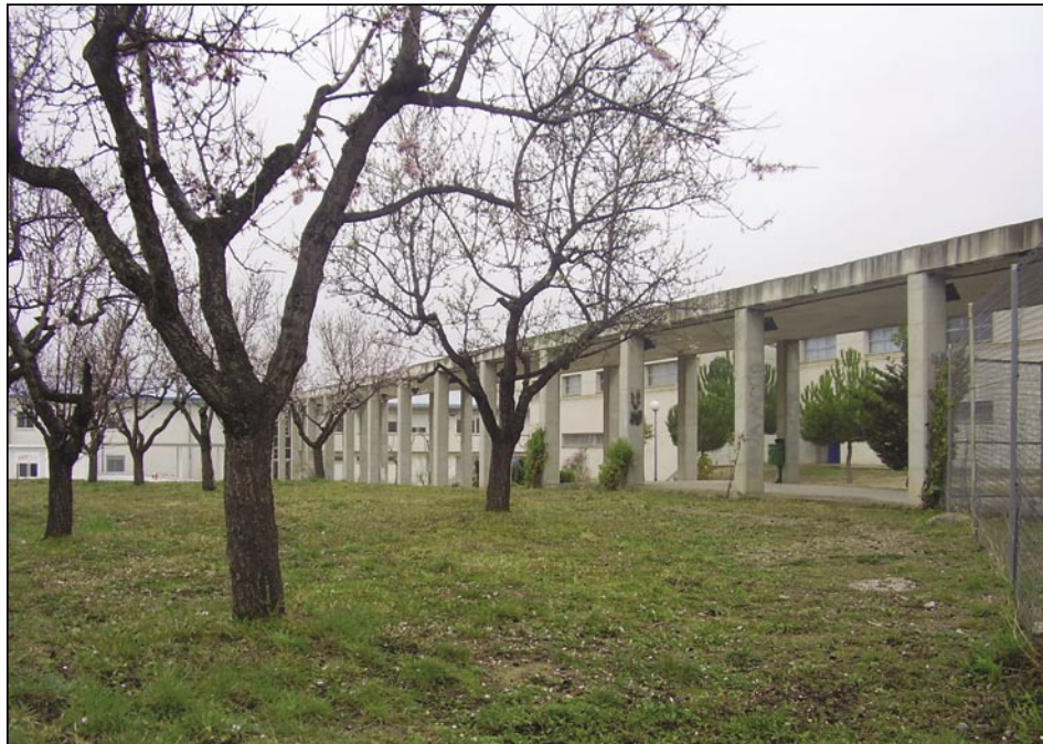
Terrenys on es construirà l'escola bressol

El passat 7 de gener es va signar l'acta per la qual és definitiu l'inici de la construcció de la segona escola bressol municipal a Olesa. Segons la regidora d'Educació, Magda Graells, aquesta escola serà igual de gran que la Taitom, tindrà 102 places, i a més, s'hi afegiran espais polivalents per