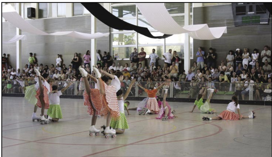
Patinatge artístic al pavelló Salvador Boada