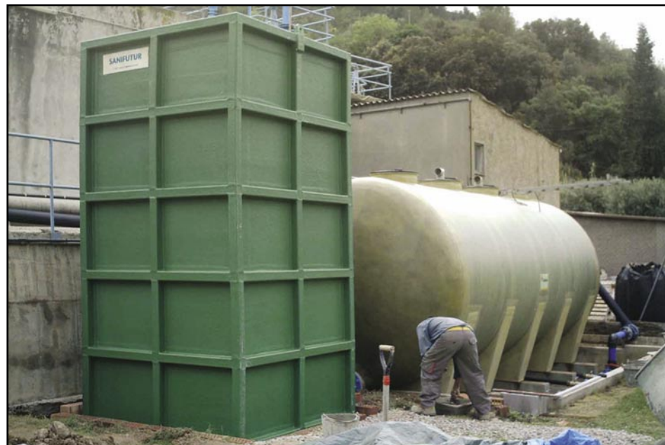
Nou sistema d'aprofitament de l'aigua

Dins del pla d'objectius 2008-2012, la Comunitat Minera Olesana, en el seu 140è aniversari, està enllestint un nou sistema de filtres amb els objectius de posar a la xarxa de distribució el mà-