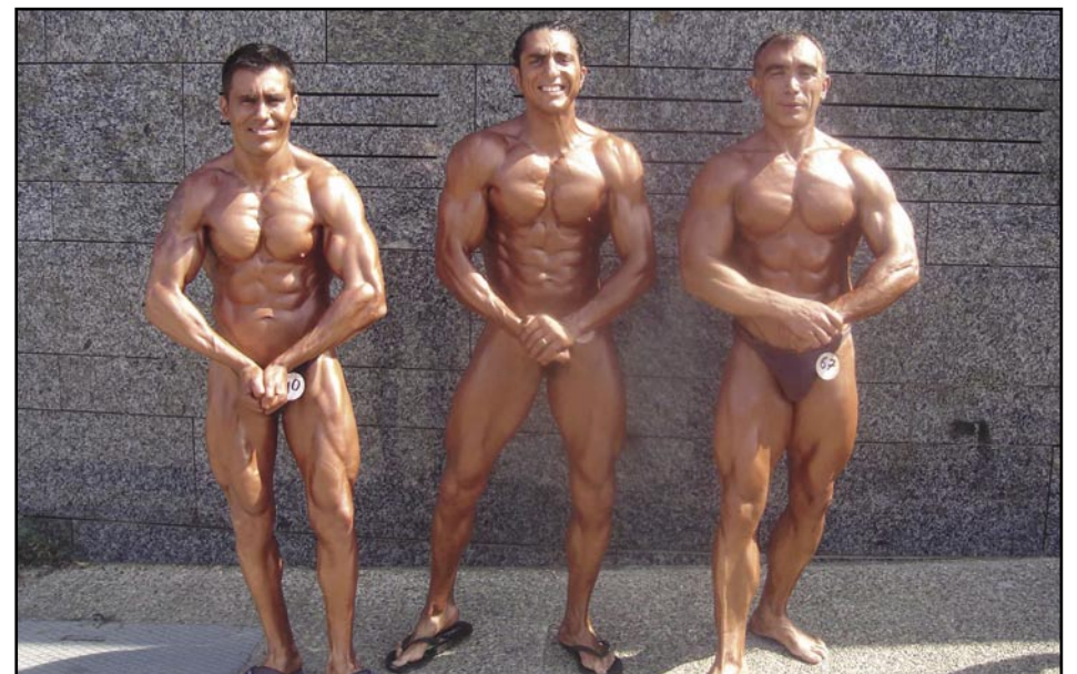
Els olesans al Campionat europeu