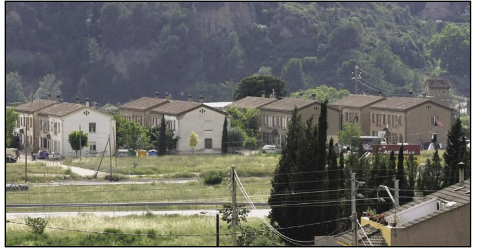
Vista de La Flora