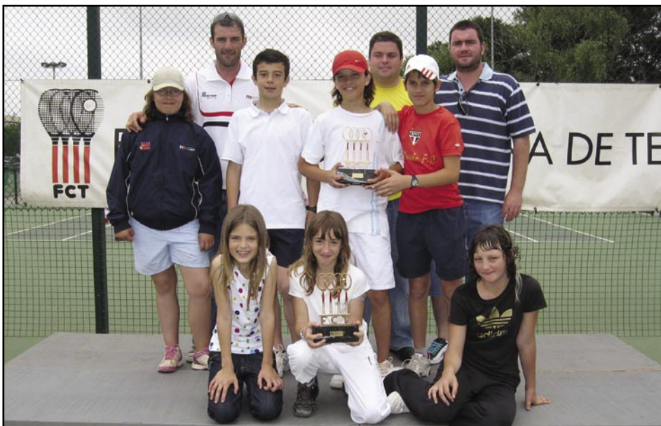
Els juvenils olesans a la III Lliga de l'Anoia

El Power Olesa ha classificat a tres dels seus atletes per el Campionat de Europa de la UIBBN (Unió Internacional de Body Builder Natural) que es