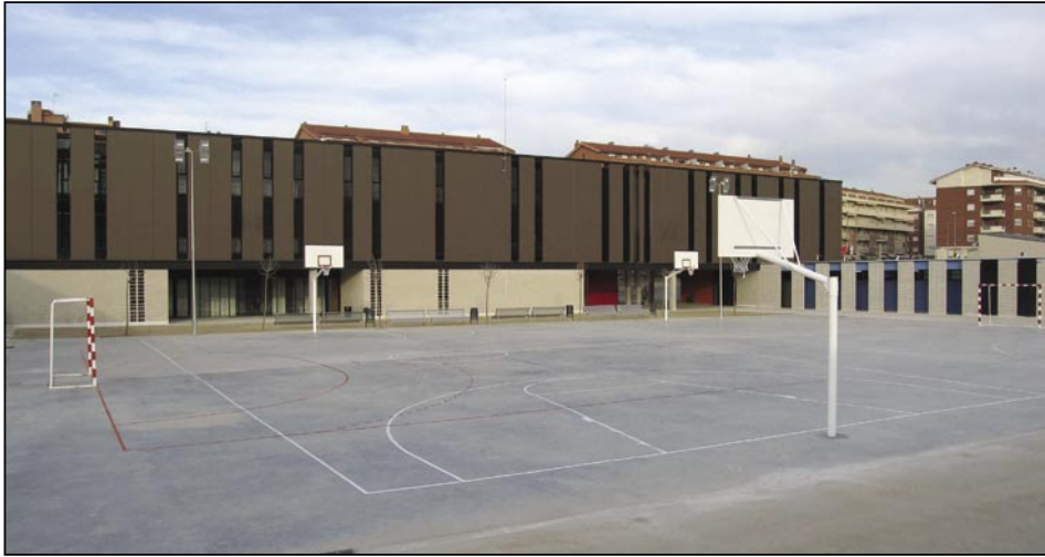
Nou nom per l'IES Olesa