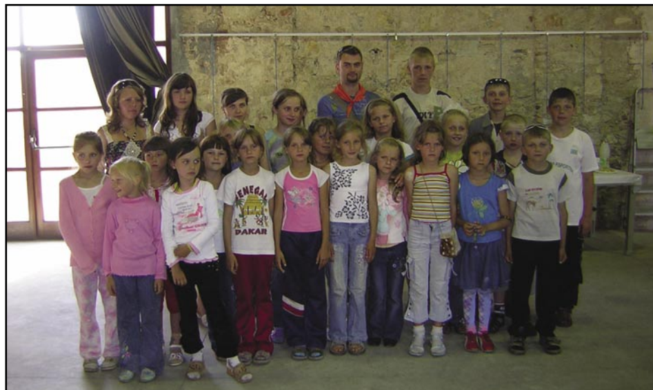
Nens i nenes bielorussos