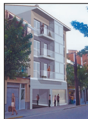
C/ DEL PROGRES 15-17-19 OLESA DE MONTSERRAT