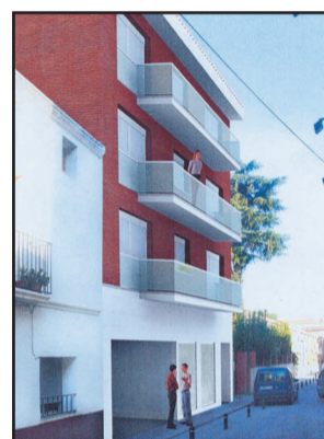
C/ DEL CALVARI 53 I 55 OLESA DE MONTSERRAT