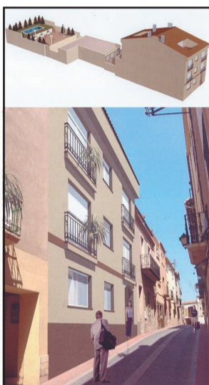
C/ CREU REAL 11 I 13 OLESA DE MONTSERRAT