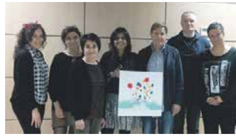
El jurat amb el cartell

Són els milions d'euros que, al ple ordinari del mes d'abril, l'Ajuntament ha aprovat per a fer front a diferents projectes d'inversions i que provenen del romanent de Tresoreria. El principal projecte és la riera de Can Carreras, per al qual l'Ajuntament hi destinarà 1.250.000 euros. La resta dels diners es destinaran a actuacions com la millora del clavegueram