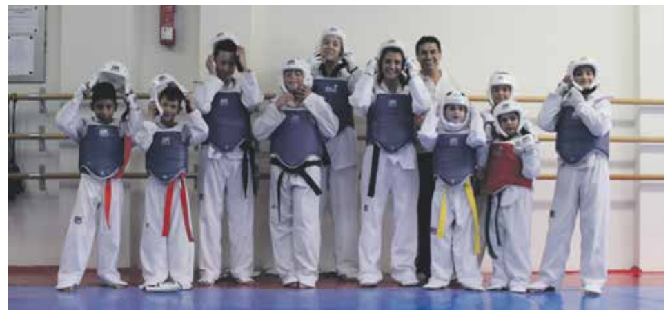
El futur del taekwondo olesà