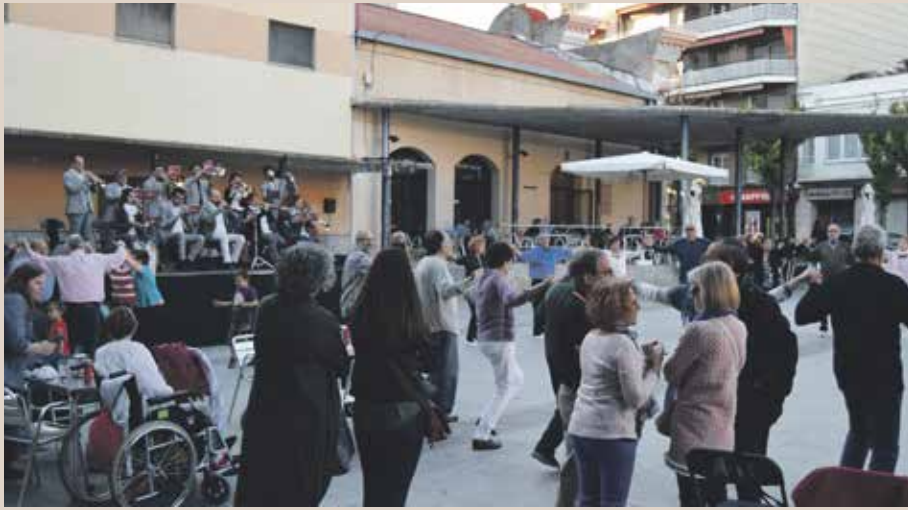
Sardanistes a La Sardana