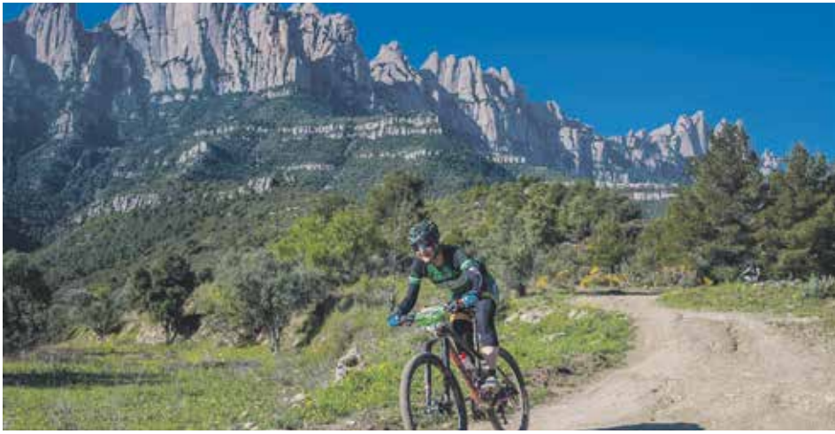
Bones sensacions a La Portals