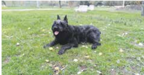
El gos agraït