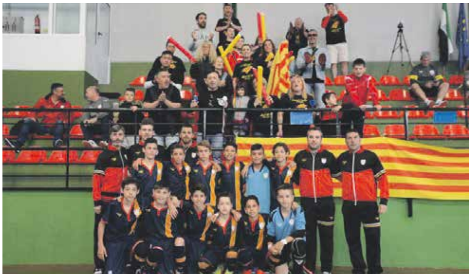
Casi a la final