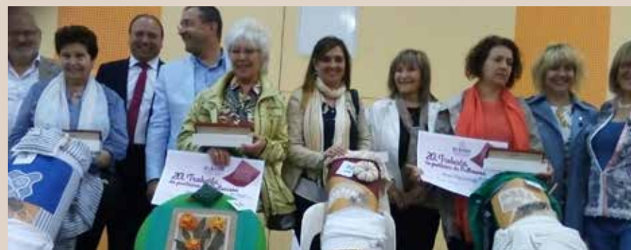
L'olesana, amb el número 12