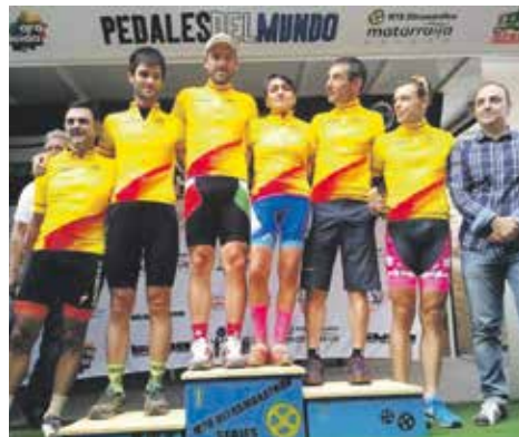
La nostra ultramaratonista