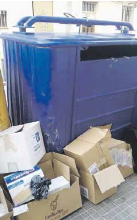
Brutícia al carrer