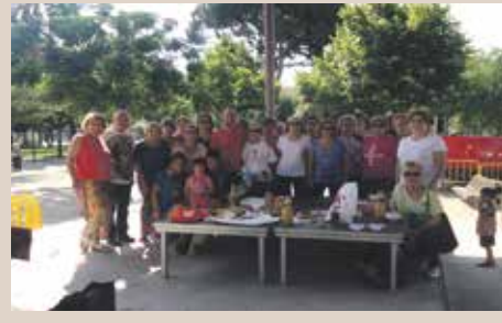
Fi del Chi Kung

Pel que fa pròpiament a les 3 sortides nocturnes, que s'han celebrat aquest estiu, la primera va ser el 17 de juliol fent una ruta circular pel Camí de Brugueros amb arribada al Pla del Fideuer i retorn pel camí de les Escaleres. Tot i ser la primera excursió nocturna, l'assistència va ser de 38 persones. Ja durant el mes d'agost, es van fer dues sortides guiades nocturnes més, la primera fou el 7 d'agost en què els participants van visitar la Masia de Puigventós i l'ermita de Sant Pere Sacama amb 47 persones i 13 km. La última sortida, va ser el passat 12 d'agost amb la intenció de veure les Perseïdes (pluja d'estels). Fins a última hora el temps meteorològic va ser imprevisible, però el cel es va obrir a