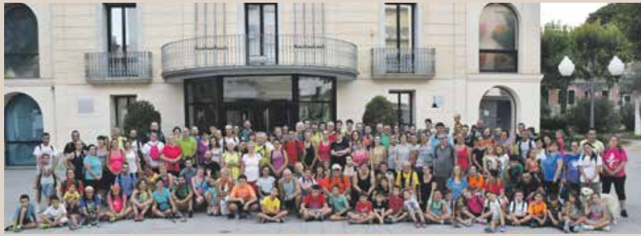
Èxit en les sortides