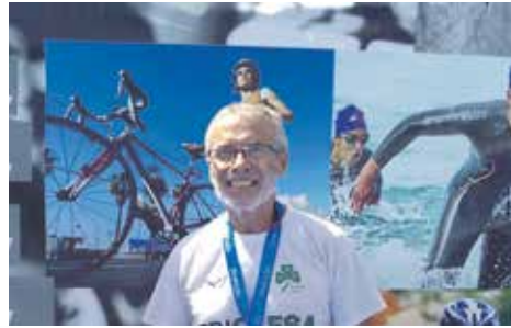
Pareja al pòdium