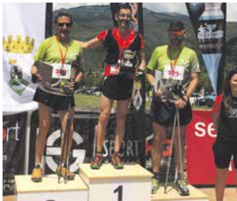
Primer en marxa nòrdica