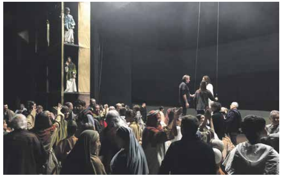
Fins l'any que vé