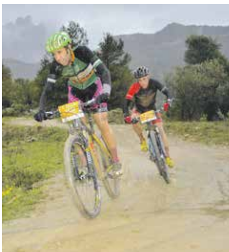
Éxit de La Portals