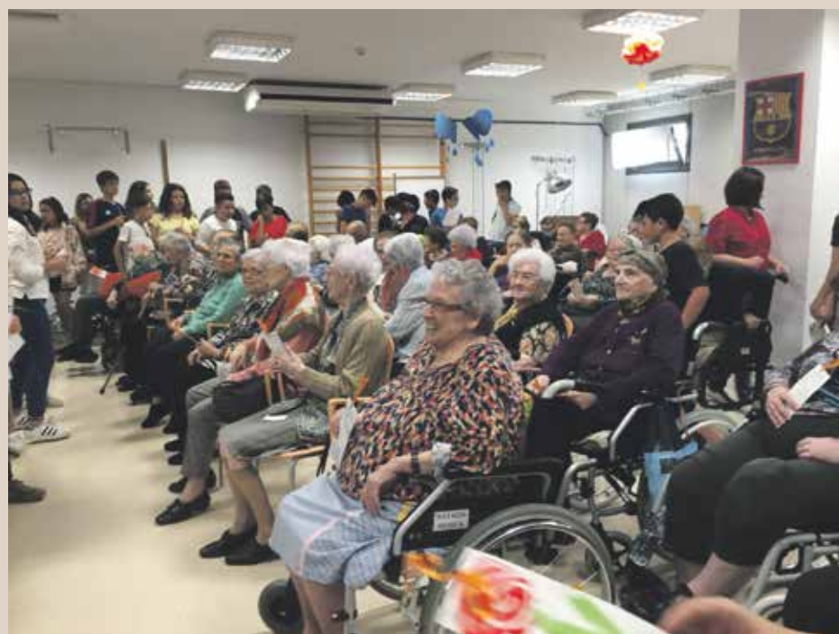
Els nens i els avis

Un altre dels moments importants de l'assemblea va ser l'anunci dels actes per commemorar els 150 anys de la cooperativa. El primer acte arribarà el 10 de juny, amb un oferiment d'una llàntia a Santa Oliva. El gruix d'actes de