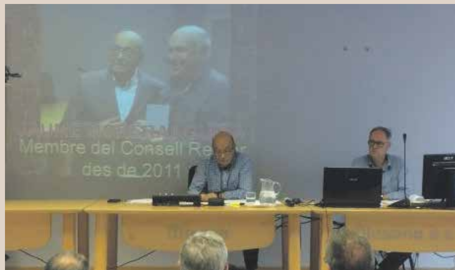
Joan Arévalo d'assemblea

les nenes van regalar un punt de llibre als avis i les àvies fet a l'escola i els van cantar una cançó relacionada amb aquesta festa. Per a tots va ser una experiència molt enriquidora i plena d'emocions. Des de l'escola, esperen amb molta il·lusió celebrar amb ells la propera Diada!