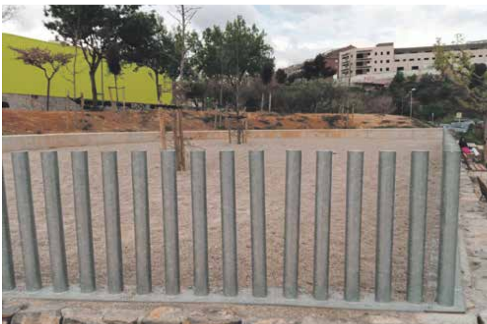
Les llars d'infants, de preinscripció

La resta de participants també van obtenir un diploma acreditatiu de la seva participació al certamen.