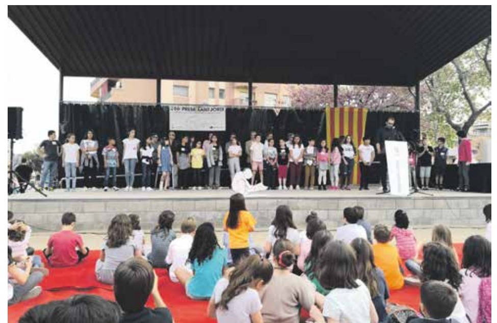
Premis Sant Jordi