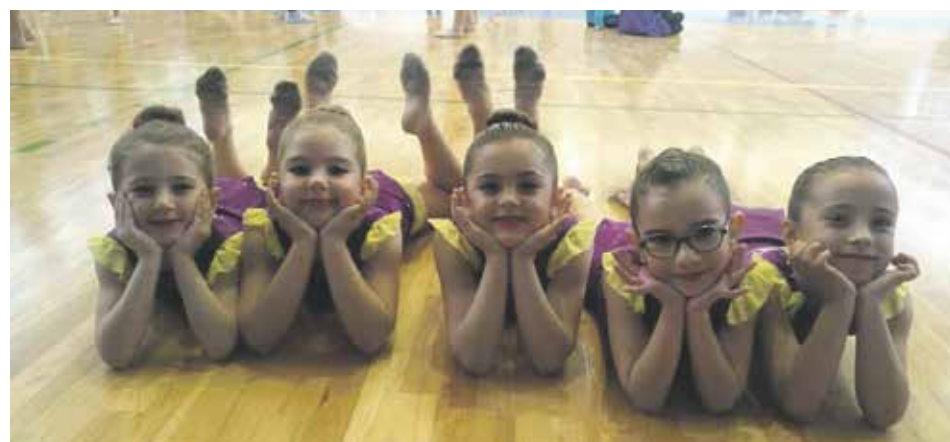
Les gimnastes olesanes